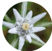
エーデルワイスエキス

3種類のオーガニック成分が頭皮にみずみずしいうるおいを与え健やかな美しい髪を保ちます。