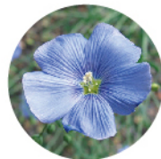
フラックスエキス