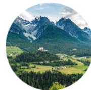
スクテラリアアルピナエキス

100%有機栽培法※1により育まれた、スイス原産のオーガニック成分です。 ※1 有機栽培法…殺虫剤、無機肥料、除草剤を使用しない栽培方法。 ※シャンプー&トリートメント全商品に使用。